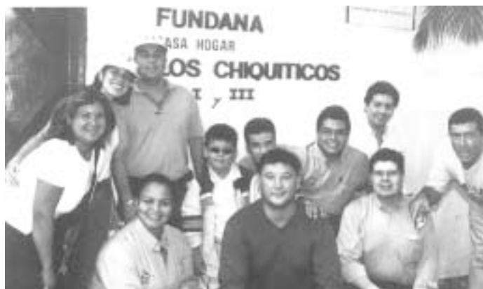
bildet viser medlemmer av "unge" Caracas Rotary Club foran et barnehjemsprosjekt som de støtter opp om.