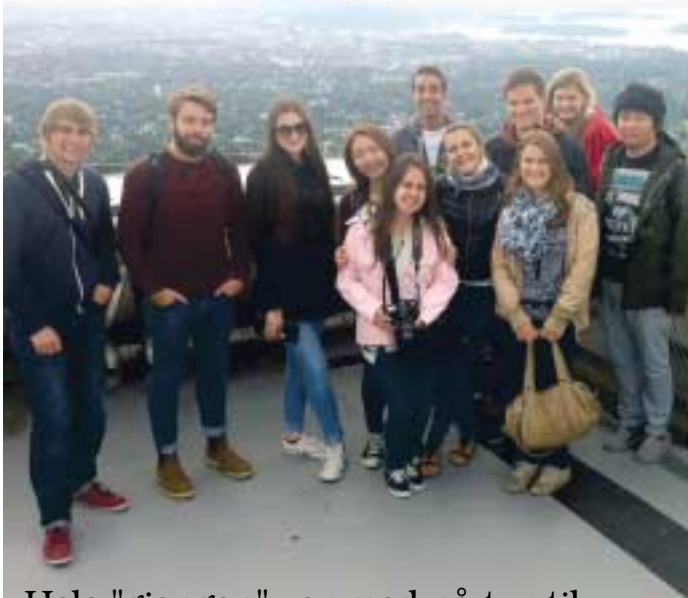
Hele "gjengen" var med på tur til Oslo hvor bl.a. toppen av Holmenkollen var "høydepunktet"