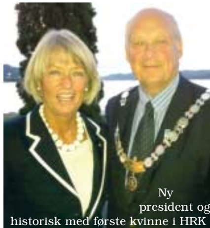
Ny president og historisk med første kvinne i HRK