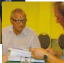
I september ble også klubbårets første styremøte avholdt