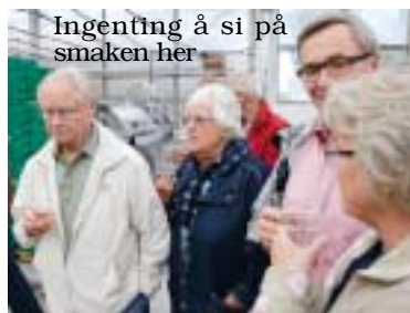
Ingenting å si på smaken her