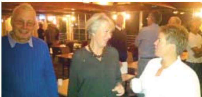
Rotarianere og ikke Rotarianere i friske konstruktive diskusjoner både under møtet, og i pausen.

Når det gjelder arealdisponeringen i Holmestrand påpekte kommuneadministrasjonen viktige vekstbehov og forutsetninger for utvikling. Samtidig framkom det et ekspansjonsdilemma, der Sentrums-, Kleivbrottet- og Bentsrud interessene markerte seg i ulike posisjoner.