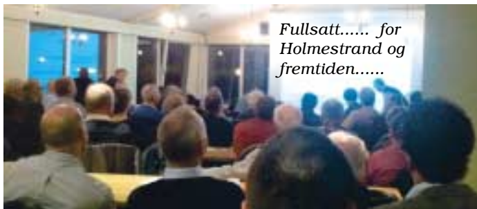
Fullsatt..... for Holmestrand og fremtiden.....