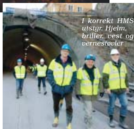
I korrekt HMS utstyr. Hjelm, briller, vest og vernestøvler

Like før vi i fullt verneutstyr trakk oss inn i berget, smalt det så alt rundt oss ristet.