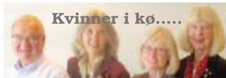
Kvinner i kø.....