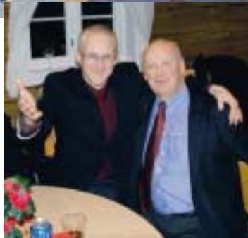
tekst/bilder Ivar Jon