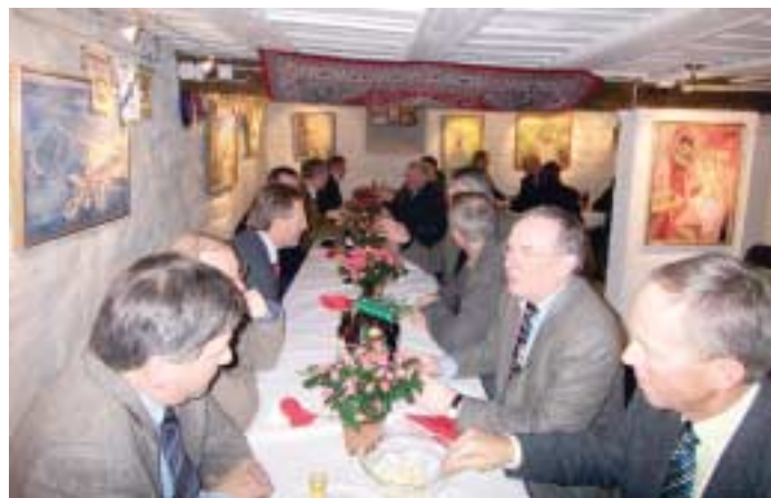
Bilder fra julemøtet den 18. desember.