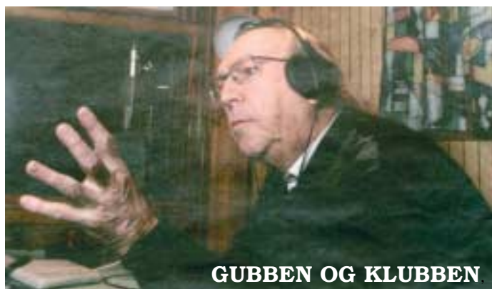
GUBBEN OG KLUBBEN