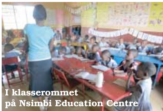
I klasserommet på Nsimbi Education Centre

....og da er det også snart tid for vårt tradisjonelle julemøte med mye god mat, godt drikke, en og annen god historie, og vårt årlige lotteri til inntekt for Nsimbi Education Centre.