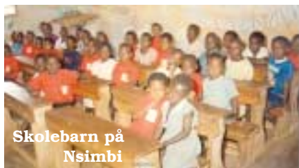
Skolebarn på Nsimbi