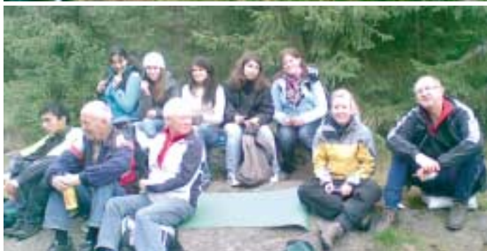
Bilder fra turen til Brannåsen med 6 utenlandske utvekslingsstudenter. Se reportasje neste side.....