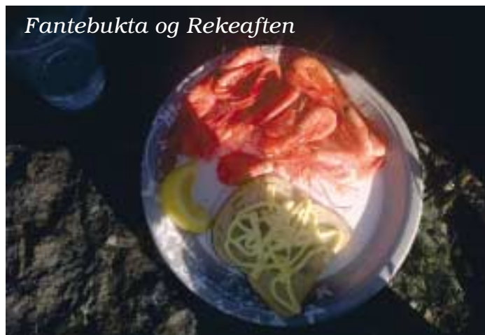
Fantebukta og Rekeaften