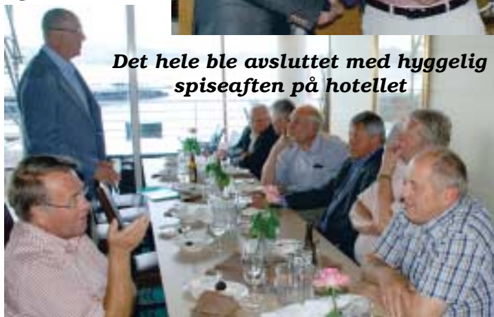
Det hele ble avsluttet med hyggelig spiseaftnen på hotellet