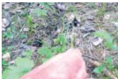
Håkon viste oss fredet flueblomst

24. juni ble nok en gang tradisjonen med avslutning i Fantebukta på Kommersøya gjennomført. Og igjen hadde arrangementet fortjent flere deltakere. Men i sommertiden må vi bare innse at folk dras både øst-, vest-, nord- og ikke minst sydover. Uansett ble arrangementet en suksess av flere grunner. Vi må lete lenge etter en avrundning med bedre vær! "Perfekt!" - vil månedsbrevredaksjonen hevde. I Toms fravær ble arrangementet denne gangen rislet gjennom Timmys stødige never. Med FLOTT INNSATS og vellykket resultat!