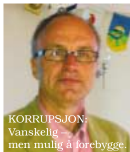
KORRUPSJON: Vanskelig – men mulig å forebygge.