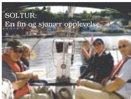
SOLTUR: En fin og sjønær opplevelse.

Igjen fikk vi erfart at like før sommerferien ankommer, så gjør det seg med en avrunding på klubbens tradisjonelle friluftsaena. Og når lun kveldssol varmet Gåserumpa under vår seilas mot