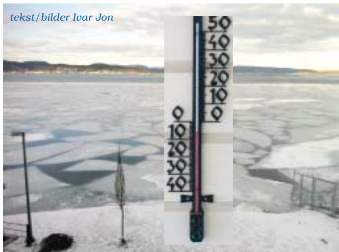
tekst/bilder Ivar Jon

aktiviserende "tiltak på timen". Michelsen informerte om NAVs mange innsatsområder. Vi fikk høre om profesjonelle og engasjerte medarbeidere. Vi lærte også at NAV i Holmestrand trives i nye lokaler - og at standarden virker positivt inn, også på de som kommer for å få sine tjenester der. Videre fikk vi vite at et samarbeidsprosjekt mellom kommunen, NAV og fastlegene har senket sykefraværet lokalt. Spørsmålene var mange, ivrige, dels også kritiske. Men Michelsen kunne svare. Avslutningsvis overrakte presidenten derfor ikke bare tradisjonell takk, men bidro samtidig til samstemt, rungende applaus. Men arbeidet med å holde sykefraværet nede må det jobbes med kontinuerlig.