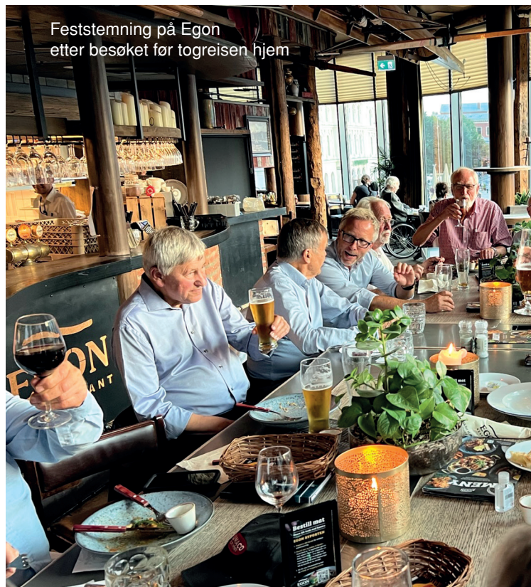
Feststemning på Egon etter besøket før togreisen hjem