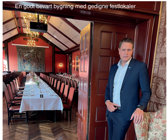
En godt bevart bygning med gedigne festlokaler