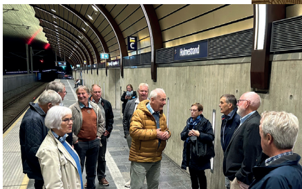
Spente deltakere samlet på Holmestrand før avreisen.