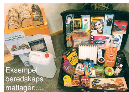
Eksempel: beredskaps matlager.....

Jeg oppfordrer dere i god Rotary ånd - husk på egen beredskap: