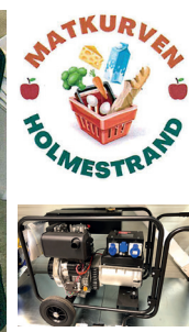
Dugnad Matkurven Strømaggat til Ukraina