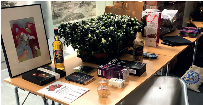
Bordet bugnet av flotte gevinster. Her ser du noen av de.