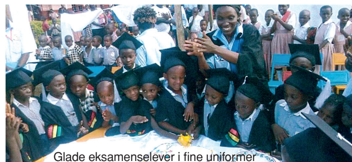
Glade eksamenselever i fine uniformer