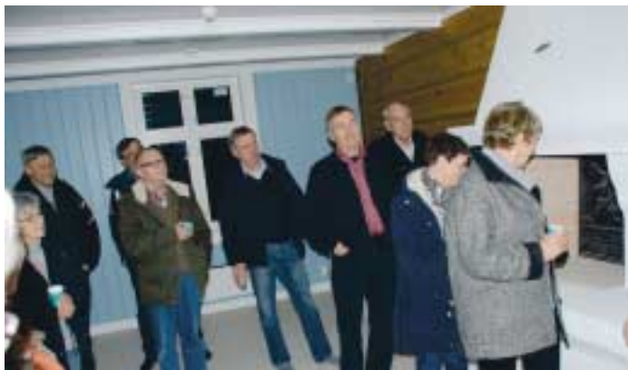
Stort oppmøte denne kvelden. Interesserte Rotarianere med fruer, venner og kjente fikk se et imponerende husprosjekt.