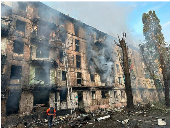
Angrepet traff en boligblokk med mange sivile, ifølge lokale myndigheter.

Tusenvis av hardt skadde og sårede soldater og sivile lider og dør. Sykehus og helsestasjoner i frontnære områder er lagt i grus. Akuttmedisinsk hjelp ligger milevis fra de hardt rammede områdene. Et tappert kjempende folk ber om vår hjelp, og det haster! De daglige rapportene fra krigsområdene er rystende lesning. Denne brutale krigen rettes mot sivile mål, store boligblokker bombes og rammes hardt, broer og demninger kollapser. Selv tapre og modige redningsmannskaper beskyttes under forsøk på å redde rammede flomofre fra drukningsdøden! Alt så uendelig grufullt og trist. Så ille at vi finner ikke ord for de brutale og grufulle krigshandlinger våre naboer nå er utsatt for.