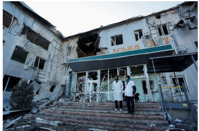
Hudrevis av sykehus er ødelagt

Gode rotarianere,- ingen kan gjøre alt, men alle kan gjøre noe! Mange av dere har allerede bidratt godt, og dette har Rotary i Ukraina flere ganger takket oss for. Og vi må fortsette og gjøre det aller beste,- hver og en av oss. Det handler om å redde liv og det handler om å lindre grufulle smerter. Våre naboer trenger all den godhet og omtanke vi kan gi dem!!